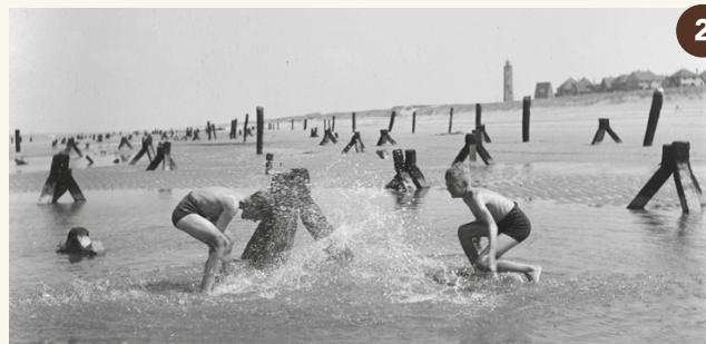
2. Tetraëders op het strand vlak na de oorlog (1945).

Je staat hier op de 'Brink', het centrale deel van het Barakkendorp. Hier waren in de Tweede Wereldoorlog Duitse militairen gelegerd die op het vliegveld werkten. De Duitsers ontwierpen de barakken met opzet als gewone huizen en boerderijen zodat het militaire complex vanuit de lucht op een dorp leek, waardoor geallieerde vliegers werden misleid. Lees er meer over op het informatiepaneel.