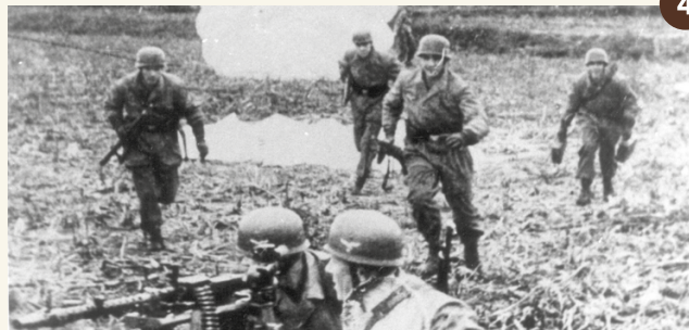
4. Meidagen 1940: Duitse parachutisten zijn op en rond het vlieggfeld geland.

De herinnering aan Vliegfeld Valkenburg en haar rijke geschiedenis levend houden, dat is wat Stichting Historie Vliegfeld Valkenburg wil. Gebouw 250 op het voormalige marinevlieggkamp verandert in een bezoekerscentrum met een permanente expositie, thema-exposities, een veteranencafé en lesmogelijkheden. Kijk voor openingstijden op www.vlieggfeldvalkenburg.nl .