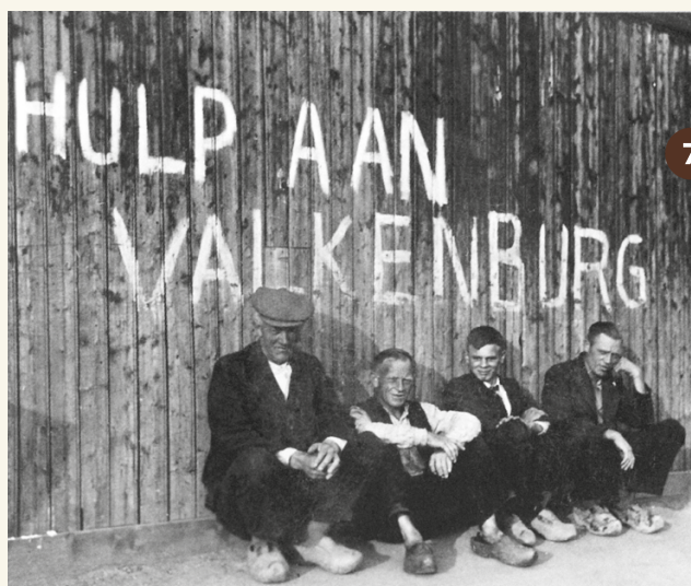
7. Na de gevechten in de meidagen van 1940 wordt voor de zwaar getroffen Valkenburgers een noodactie opgezet (1940).

Baggermolen waarmee de tankgrachten werden gegraven (1942-1943).