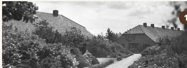
1. Doorkijk in het Barakkendorp (rond 1950).