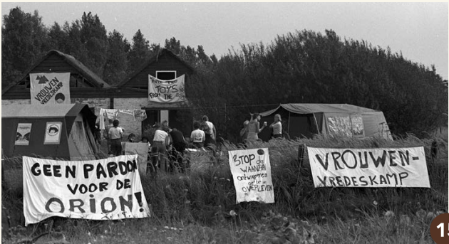
15. Vrouwen richten vlakbij het vliegveld een Vrouwen Vredeskamp in (1982).

Na 1996 zijn de bollenbedrijven verplaatst. Het gebied is veranderd in een glooiend terrein met beken en plassen. Er zijn al meer dan honderd soorten vogels waargenomen. Naast de hier uitgezette Schotse Hooglanders en Koniks paarden komen hier reeën, vossen en hazen voor. Je kunt er wandelen over het speciaal aangelegde graspad. Het natuurgebied is zó bijzonder dat het op Europees niveau wordt beschermd in het Natura 2000-programma.