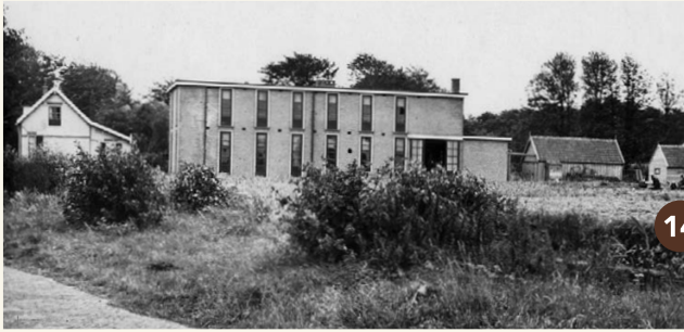
14. Een bollenbedrijf aan de Katwijkseweg (circa 1945).

Meer informatie: www.staatsbosbeheer.nl en www.bunkersinwassenaar.nl .