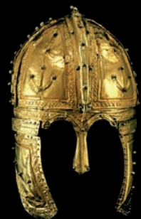
Foto: Vergulde zilveren ruitershelm, RMO